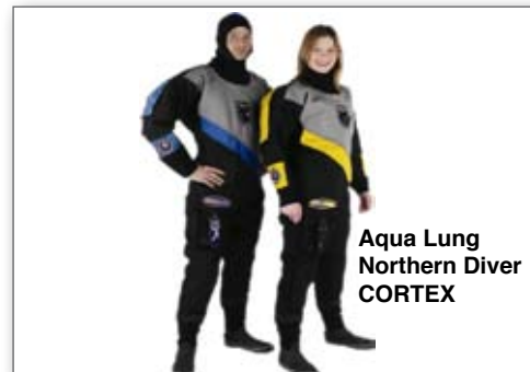
Aqua Lung Northern Diver CORTEX

Mit dem Northern Diver CORTEX hat Aqua Lung noch einen echten Allrounder im Programm: Der Cordura-Membrantrocki hat einen Rückeneinstieg und ist in den Farben Schwarz/Gelb/Silber (G) und Schwarz/Blau/Silber (B) erhältlich. Besonders hervorzuheben sind die extra dicken Stiefel, die integrierten Hosenträger und Wärme-Protectoren an Hals und Handgelenken.