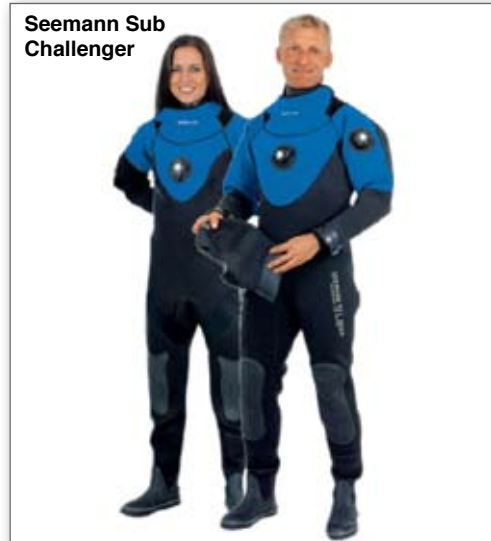
Seemann Sub Challenger