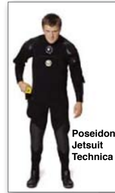
Poseidon Jetsuit Technica

Das erste vorgestellte Modell hört auf den etwas umständlichen Namen Unisuit Exclusive Hardboot . Dahinter verbirgt sich ein Trockentauchanzug aus 6,5mm Neopren mit fester Kopfhaube, Neopren-Halsmanschette und doppelter Neopren-Armmanschetten. Verstärkung