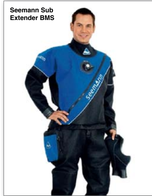
Seemann Sub Extender BMS