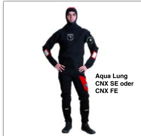
Aqua Lung CNX SE oder CNX FE

Für Wracktaucher ideal ist der CNX SE (Rückeneinstieg) oder CNX FE (Front-einstieg diagonal). Gefertigt aus su-perbequemen und extrem robusten 2,5 mm Crash-Neopren kommt der Trockki ab Werk mit Hartsohlenboots, Reflektor-streifen und Kevlar-Kneepads daher.