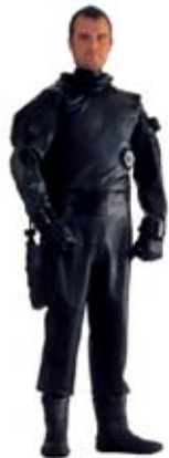
Viking Pro Tech

Beeindruckend kommt es daher, das auf den Namen Pro Tech hörende Spitzenmodell der Edelschmiede. Der Viking Pro Tech wurde speziell für Taucher konzipiert, die extreme Anforderungen an Flexibilität und Haltbarkeit stellen – in dem auf der „boot“ 2007 vorgestelltem Anzug steckt die ganze Erfahrung von 50 Jahren Produktion drin! Alleine das Anzugmaterial Gummi macht den Viking zum Exoten auf dem deutschen Markt, der Vertrieb läuft über die Domeyer GmbH in Bremen.