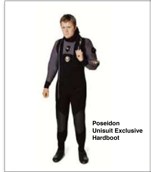
Poseidon Unisuit Exclusive Hardboot