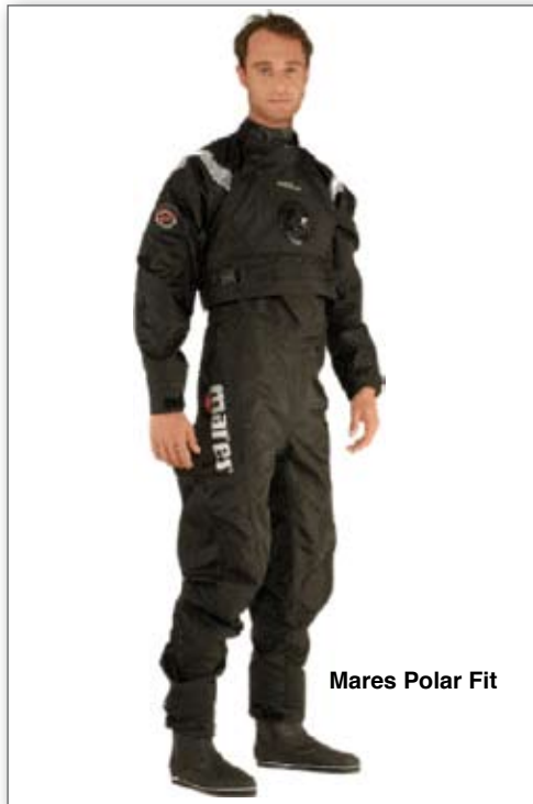
Mares Polar Fit