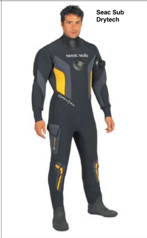
Seac Sub Drytech

an den Knien, das frostgeschütztes Einlassventil, ein manuelles Auslassventil – diesen Anzug bringt so schnell nichts aus der Ruhe! Auf Wunsch auch mit Softboots gegen Aufpreis erhältlich.