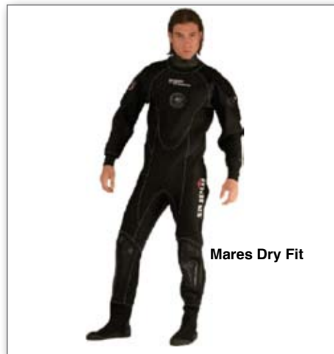
Mares Dry Fit